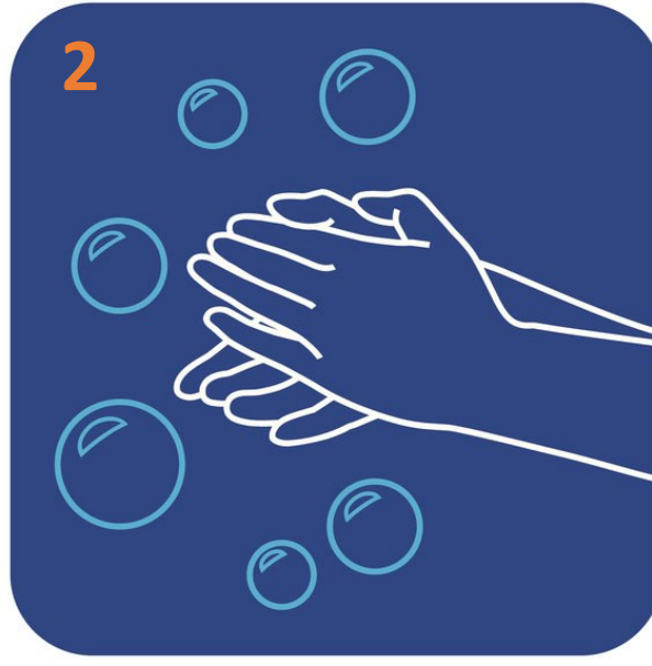
Aplice jabón; restriegue las manos por 20 segundos y enjuague