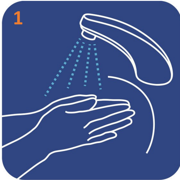
Moje sus manos