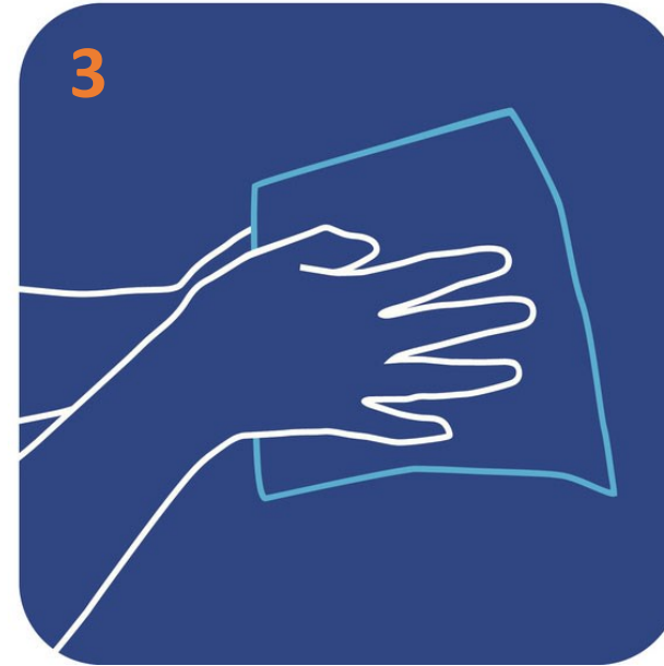
Séquese las manos con una toalla desechable